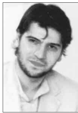
● سامي يوسف

وعن سبب تأخره في تقديم الشكوى بعد سنوات من توريد الأغاني، قال سلامة: «في البداية كنت اعتقد أن شركات مصرية وراء إنتاج هذه الاغاني ولكن عندما سألت في جمعية المؤلفين والملحنين اكتشفت ان وهبي ويوسف انتجا الاغنيتين بأنفسهما، الأمر الذي استفزني واستفز موسيقيين آخرين، ورأيت ان الشكوى لنقابة الموسيقيين هي الحل الوحيد، خاصة إن سامي يوسف قدم «لا إله إلا الله»، في دار الأوبرا طلبت منه عدم غنائها لكنه يغنيها حتى اليوم.