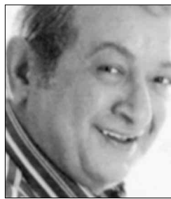
● نور الشريف

يصور نور الشريف حالياً في لندن المشاهد الخارجية والرئيسية للجزء الثاني من مسلسل «الدالي»، والذي يدور موضوعه حول مواجهة الدالي للمافيا في لندن وماسيليا. ويشارك نور الشريف في المسلسل الذي يخرج يوسف شرف الدين سوسن بدر وصالح رشوان وبعض الوجوه الجديدة.